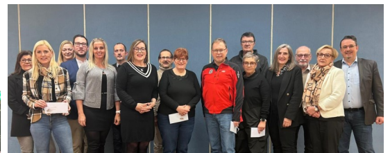
-Besuch der Veranstaltung „Kraft das Murtal“.